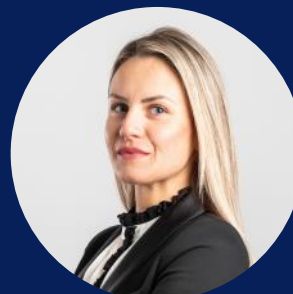
Adaleta Merkez Projektleitung TeamWork

“Das Projekt war eine echte Herausforderung! Wir haben es aber gemeinsam geschafft, eine moderne und attraktive Lösung umzusetzen. Unsere Ansprechpersonen bei der Berner Fachhochschule sind sehr gute Ideengeber und haben massgeblich dazu beigetragen, eine nachhaltige Lösung zu entwickeln, welche das tägliche Geschäft in hohem Masse erleichtert.“